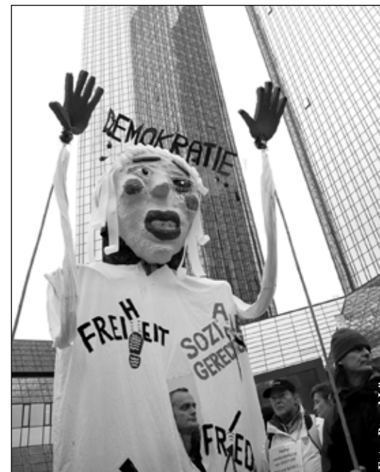
Bankenumzingelung Frankfurt, 12. 11. 2011 – siehe 17.3.