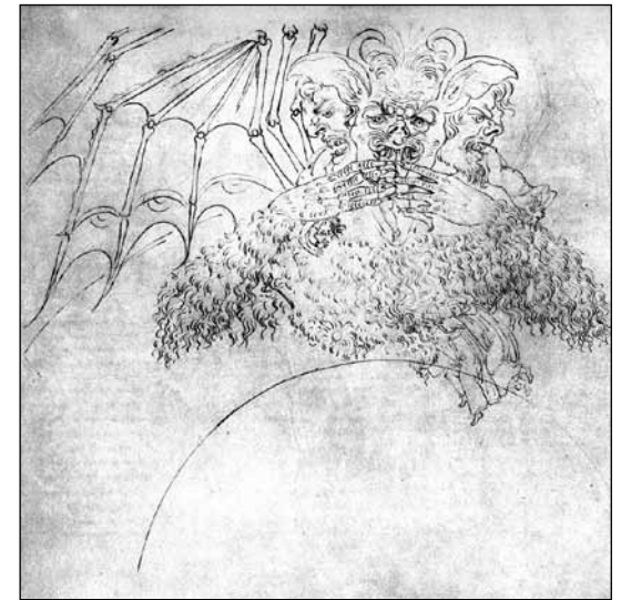
Sandro Botticelli: Hölle – siehe 18.9.

Sa 25.8. 14.00 U-Bahn Zoo: Straßennamen Ostend